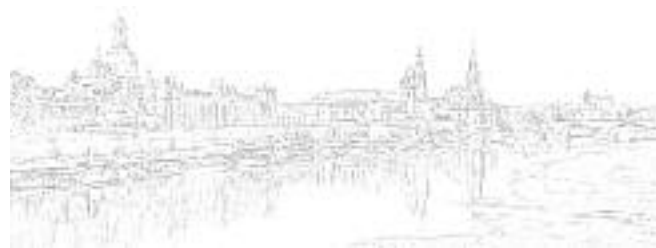
Titelfoto: Blick vom Japanischen Palais, Dresden Gestaltung: FRIEBEL Werbeagentur und Verlag GmbH