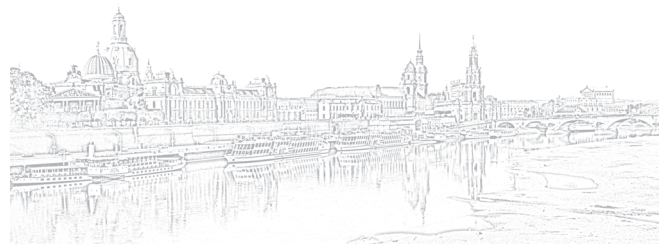
Titelfoto: Blick vom Japanischen Palais, Dresden Gestaltung: FRIEBEL Werbeagentur und Verlag GmbH